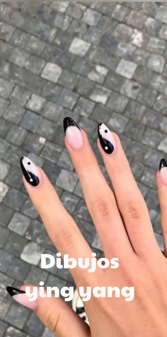
Dibujos ying yang