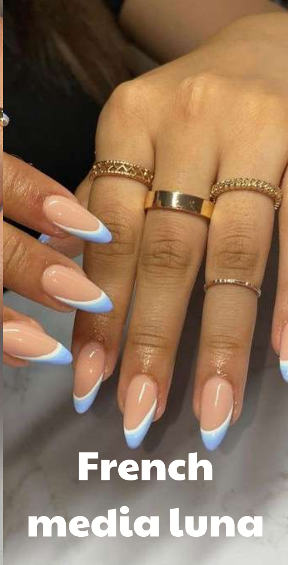
French media luna