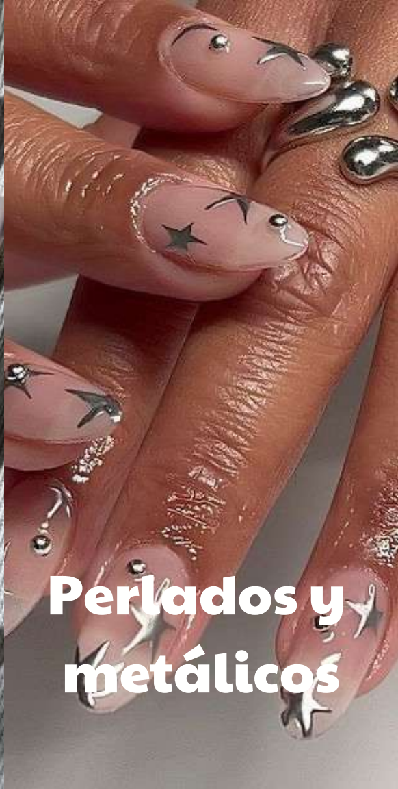
Perlados y metálicos