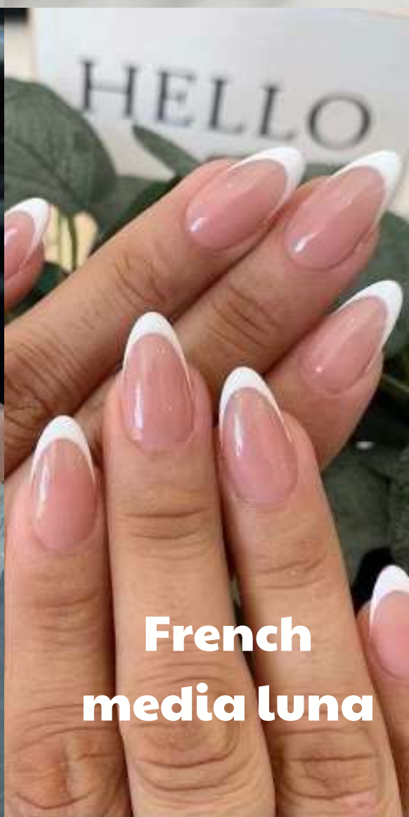
French media luna