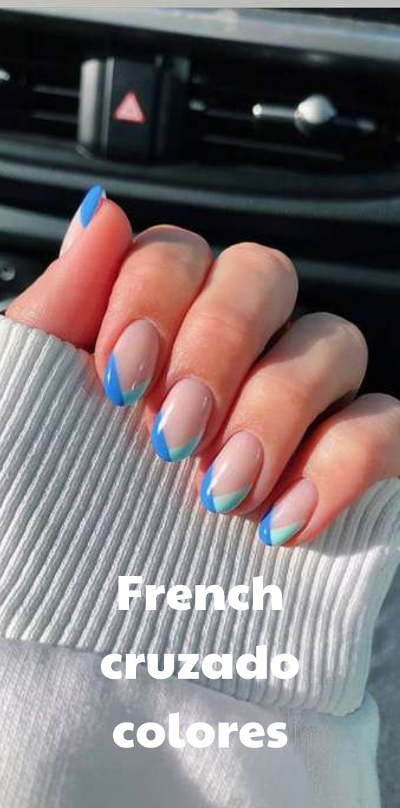
French cruzado colores